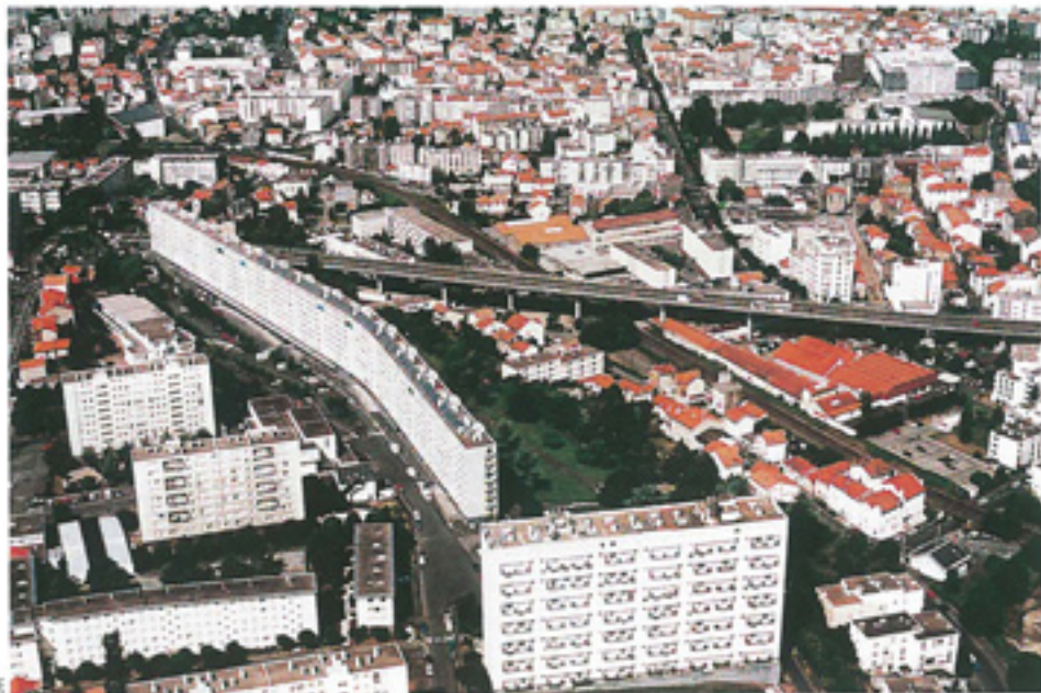
European. Site de Clermont-Ferrand.

EUROPAN Lancement à Berlin, le 9 novembre dernier, de la sixième session du concours European, concours d'idées réservé aux jeunes architectes européens qui, cette année, propose de réfléchir à la problématique des quartiers composites situés à la frange des centre-villes. Sous le thème « Entre villes, dynamiques architecturales et urbanités nouvelles », European 6 confirme la tendance amorcée depuis plusieurs sessions, à explorer des thématiques urbaines au détriment de problématiques simplement architecturales. L'enjeu de cette nouvelle session est donc la reconquête urbaine de fragments de territoire qui, de par leur situation privilégiée, constituent une manne réelle pour les municipalités, à la fois foncière et économique. Huit sites français figurent au programme – Clermont-Ferrand, Marseille, Montbéliard, Rennes, Roubaix, Saint-Etienne, Sotteville-lès-Rouen et Vénissieux – parmi les 67 sites européens proposés. Une présentation générale du programme et des sites a déjà eu lieu à Berlin lors du Forum de lancement européen. Que les retardataires se rassurent, il est encore temps de participer, les inscriptions se poursuivant jusqu'au 12 janvier prochain. Pour ce qui est du calendrier, la date limite de remise des projets est fixée au 5 mars 2001, pour une annonce des résultats le 26 juin.